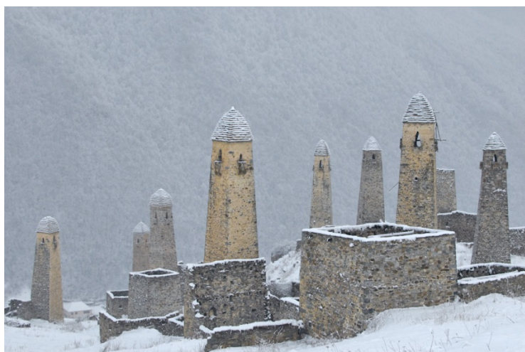
Ил. 11. Нахские башни. Эрзи (около 40 км от Владикавказа)

Земля у клана была общинная, каждая семья могла обрабатывать отдельный участок земли, но владельцем земли считалась община. В период сбора урожая часто работы осуществлялись совместно. Община помогала неимущим и пожилым людям, у которых не было сыновей. Каждый член общины был носителем группового сознания [Штейнер 1990 а, 38–47; Штейнер 1990 б, 169–172], ведь только сильный и спаянный коллектив людей мог отбиться от неожиданного вражеского нашествия или выдержать осаду. Самым строгим наказанием было изгнание из общины. За содеянные проступки или преступления члены общины готовы были подвергнуться самым суровым взысканиям, лишь бы не быть изгнанными, ведь в древности изгои считались самыми несчастными людьми, под стать прокажённому.