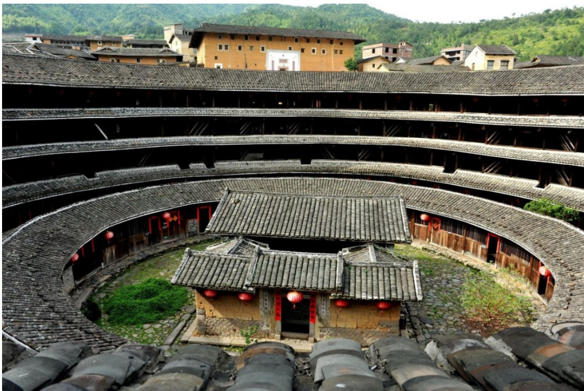
Ил. 7. Тулоу в провинции Фу