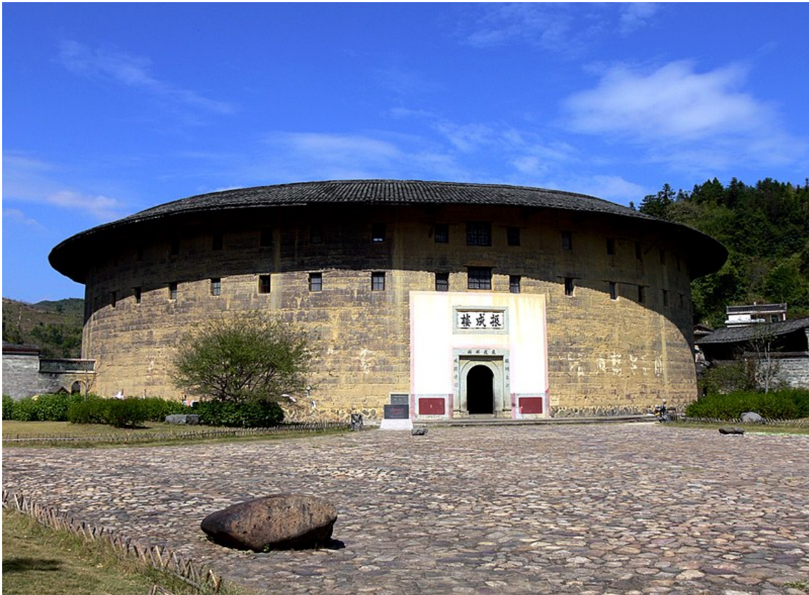
Ил. 6. Чжэньчэн Лоу