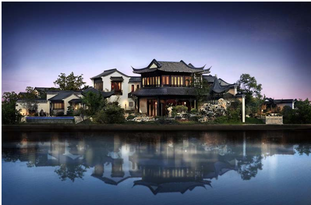
Ил. 5. Традиции сыхэюань в современной китайской архитектуре. Таохуаюань, Сучжоу (переводится как «Утопия» или «Земля цветущих персиков»)

Бедный люд жил в домах того же типа, но гораздо меньше размерами, чаще всего каждое строение было однокомнатным. Можно предположить, что простолюдины не всегда могли следовать традиционным принципам китайского домостроя, поскольку это было делом расходным: живущим впроголодь беднякам было не до канонов Фэн-шуй. Однако и в богатых усадьбах, и в домах среднего достатка всё было согласовано с принципами мироздания. В наши дни традиция строительства такого типа жилища сходит на нет, так как в перенаселённом Китае рассредоточенная планировка жилища считается непозволительной роскошью. В целях экономии пространства пересматриваются не только тысячелетние традиции градостроительства и домостроя, но и формы захоронения. Однако, в местах, где есть свободные площади, снова пытаются строить дома в стиле сыхэюань с использованием новых строительных материалов, оснащая дома всеми бытовыми условиями, вплоть до солнечных батарей (ил. 5).