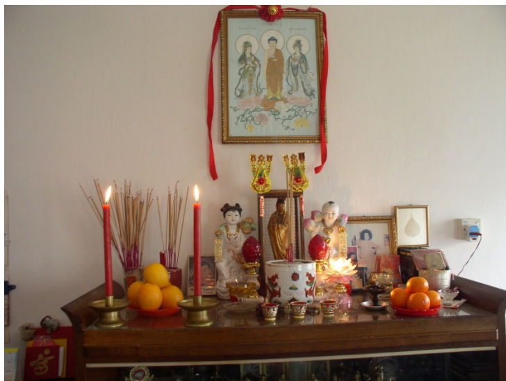
Ил. 1. Алтари и храмы были обязательной принадлежностью каждой семьи

Семьи, олицетворявшие главную линию родового культа, обязательно имели специально выстроенные храмы предков, семейные и родовые (ил. 1).