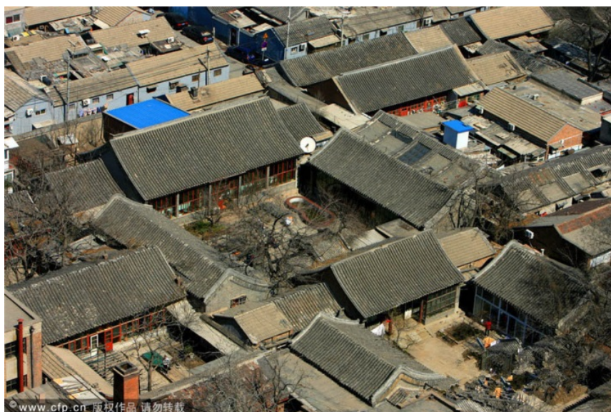
Ил. 2. Пекинские дворики

Поскольку дом для китайца – нуминозное пространство, строительство жилища мыслилось как сакральный акт, заставляющий отступить хаос и приводить в равновесие миропорядок. Это определяло планировочные принципы строений и архитектурных комплексов китайцев [Кравцова 2004, 830]. Космологические представления китайцев отразились как в строении отдельных жилищ, так и в градостроительных принципах в целом [Анашина 2021]. Китайский дом, так же как и китайский храм, является целым комплексом строений (ил. 2). Одиночные постройки, пусть даже внушительных размеров, идут вразрез с представлениями китайцев о мироустройстве. Согласно традиции, комплекс должен состоять из трёх, пяти [Тихомирова, Чжао 2012, 99] или более сооружений.