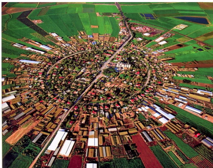
Ил. 10. Киббуц. Коммуна Мошав Шаршерет. Основана в 1921 г.

Земля у клана была общинная, каждая семья могла обрабатывать отдельный участок земли, но владельцем земли считалась община. В период сбора урожая часто работы осуществлялись совместно. Община помогала неимущим и пожилым людям, у которых не было сыновей. Каждый член общины был носителем группового сознания [Штейнер 1990 а, 38–47; Штейнер 1990 б, 169–172], ведь только сильный и спаянный коллектив людей мог отбиться от неожиданного вражеского нашествия или выдержать осаду. Самым строгим наказанием было изгнание из общины. За содеянные проступки или преступления члены общины готовы были подвергнуться самым суровым взысканиям, лишь бы не быть изгнанными, ведь в древности изгои считались самыми несчастными людьми, под стать прокажённому.