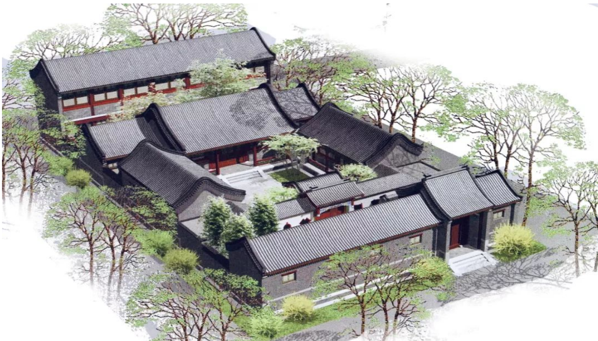
Ил. 3. Сыхэюань с двумя дворами

Усадьба сыхэюань (сы – четыре, хэ – объединять, юань – двор) – это прямоугольный в плане комплекс построек, ориентированных по частям света (север-юг, запад-восток), с неизменным двором в центре (куда смотрят фасады всех построек), главным жилым помещением на северной стороне, боковыми (восточным и западным) флигелями, кухней и подсобными помещениями. Это могли быть дома с глинобитными или кирпичными стенами, с крышами, покрытыми соломой или неглазурованной серой черепицей, с окнами, затянутыми рисовой бумагой и закрываемыми в непогоду створчатыми ставнями, с саманной или кирпичной опоясывающей стеной – всё зависело от состоятельности хозяев. Обычно вход в китайский дом располагали с южной стороны. Фасад главного строения был обращён к входу, перед которым располагался двор, в который, в свою очередь, вели ворота, которые тоже смотрели на юг. Стены, не выходящие во двор, были чаще глухими [Чу Минь 1998, 20], но в отдельных случаях в них имелись небольшие оконные проёмы.