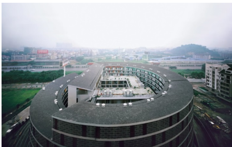
Ил. 14. Жилой комплекс «Ничья земля». Гуанчжоу

Из всего этого можно заключить , что в основу разных традиционных жилищ Китая были положены не только принципы целесообразности и удобства, но и определённые философские концепции, которые определяли архитектурные решения и инженерные особенности того или иного храма, дворца, богатого городского дома, провинциального дома-крепости. И сегодня, дивясь современному облику китайских городов, нетрудно усмотреть преемственность традиций, их удивительные трансформации и перевоплощения (ил. 14).