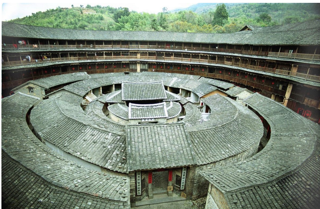
Ил. 8. 4-х концентрическая кольцевая архитектура Чэнци Лоу

Однако тулоу были не просто укрепленными посёлками. Помимо вопросов безопасности, жителей таких посёлков объединяли хозяйственные нужды, кото-