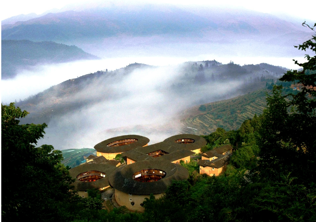
Ил. 9. Кластер Тяньлуокенг Тулоу. Провинция Фуцзянь

Кроме того, жители посёлка имели общие корни, говорили на общем наречии, имели общее недвижимое имущество, общие мировоззренческие установки, традиции, а также недоверие к властям и местным жителям, которые всегда видели в них чужаков. И в наши дни, хакка называют «китайскими евреями» [Rhee 2007, 88] или «китайскими цыганами» 2 .