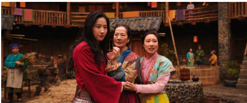
Ил. 13. Кадр из фильма «Мулан» (2020, США, КНР, Канада)

Любопытное обстоятельство: в художественном фильме «Мулан» (2020) – игровом ремейке одноимённого американского мультфильма, рассказывается о героической девушке, которая, переодевшись мужчиной, ушла на войну, чтобы спасти честь своего престарелого отца и родного клана. В результате она спасла императора и всю страну. Создатели ремейка поместили героиню в эпоху Северной Вэй или Сунь 5 в провинцию Хубэй, откуда хакка в течение чуть ли не пятнадцати столетий мигрировали на юго-восток страны. В провинции Хубэй сегодня установлен памятник Мулан. Исследователи считают, что хакка являются выходцами из этой провинции, а также из провинций Хэнань и Шэнси. В эпоху Северной Вэй и Суй – это была северная китайская граница, вечно подвергавшаяся нападениям со стороны северных варваров. По американскому фильму Хуа Мулан родилась и выросла на границе поднебесной, в типичном тулоу (ил. 13). Что ж, с исторической точки зрения всё убедительно, а главное, в фильме реалистично показан дом-крепость.