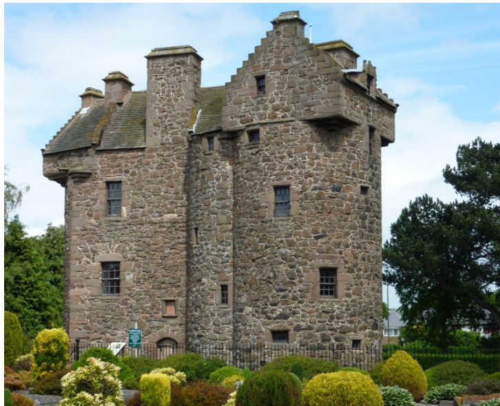
Ил. 12. Шотландский замок Клейпоттс близ Данди

Строительство нахских башен началось в XII–XIII вв., т. е. во времена монгольского и тимуридского нашествия [Ильясов 2009, 183–184, 191]. Но больше всего башен построено было между XV и XVII веками [Щеблыкин 1928, 282, Марковин 1980], тогда же было построено большинство шотландских замков [Wormald 1991; Tabraham 2005; Reid 2006]. Начало строительства тулоу также приходится на XII–XIII вв., а расцвет этого своеобразного зодчества также относится к XV–XVII вв. Удивительное совпадение!